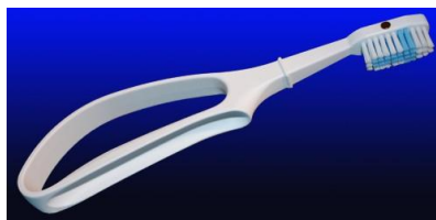
**Tini-Brush, brosse à dents avec aimants