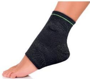
*Actiflux Knöchelschützer mit 4 magnetischen Kapseln